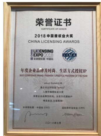
「年度最佳企業品牌／時尚／生活方式計劃」獎項